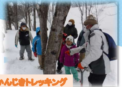
かんじきトレッキング