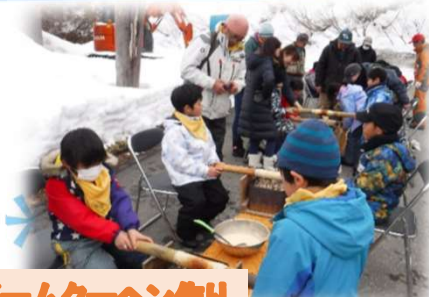
パームクーヘン作り