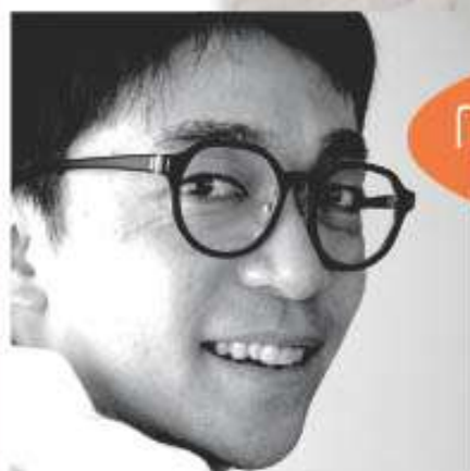
冬の大石田 AIR 前半