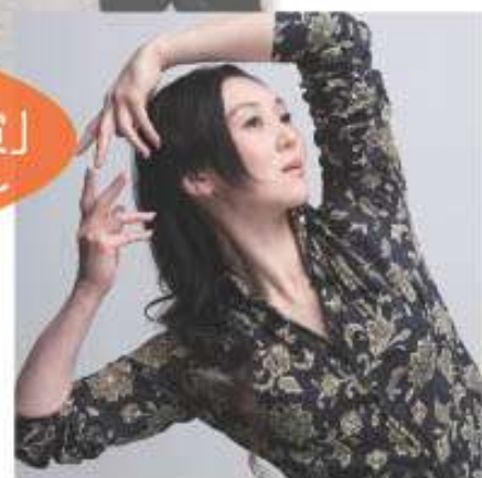
冬の大石田 AIR 後半