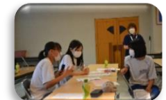
令和4年度の活動の様子①