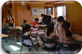
令和4年度の活動の様子