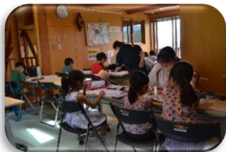
令和4年度の活動の様子②